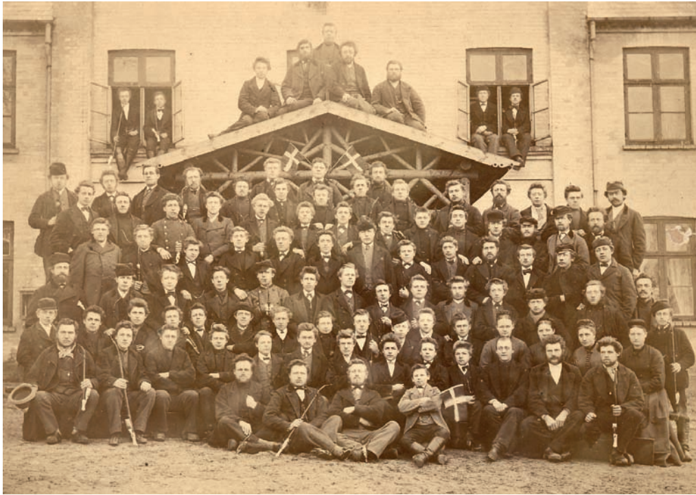
Fotografi af elevholdet på Ryslinge Folkehøjskole i 1876. Folkehøjskolerne voksede frem i stort tal i anden halvdel af 1800-tallet og fik stor betydning for uddannelsen af landboudommen.

Fra midten af 1800-tallet kunne unge og voksne blive undervist på folkehøjskoler og på en række fagskoler. Højskolernes undervisning var henvendt mod gårdmands-ungdommen og bestod af inspirerende foredrag, sang og diskussion, det var 'Det levende ords skole'. Blandt fagskolerne var landbrugsskolerne af særlig stor betydning i 1800-tallets brydningstid. På disse skoler stiftede de unge landmænd bekendtskab med nye metoder og ny viden fra ind- og udland, og en teoretisk overbygning knyttes til den praktiske oplæring.