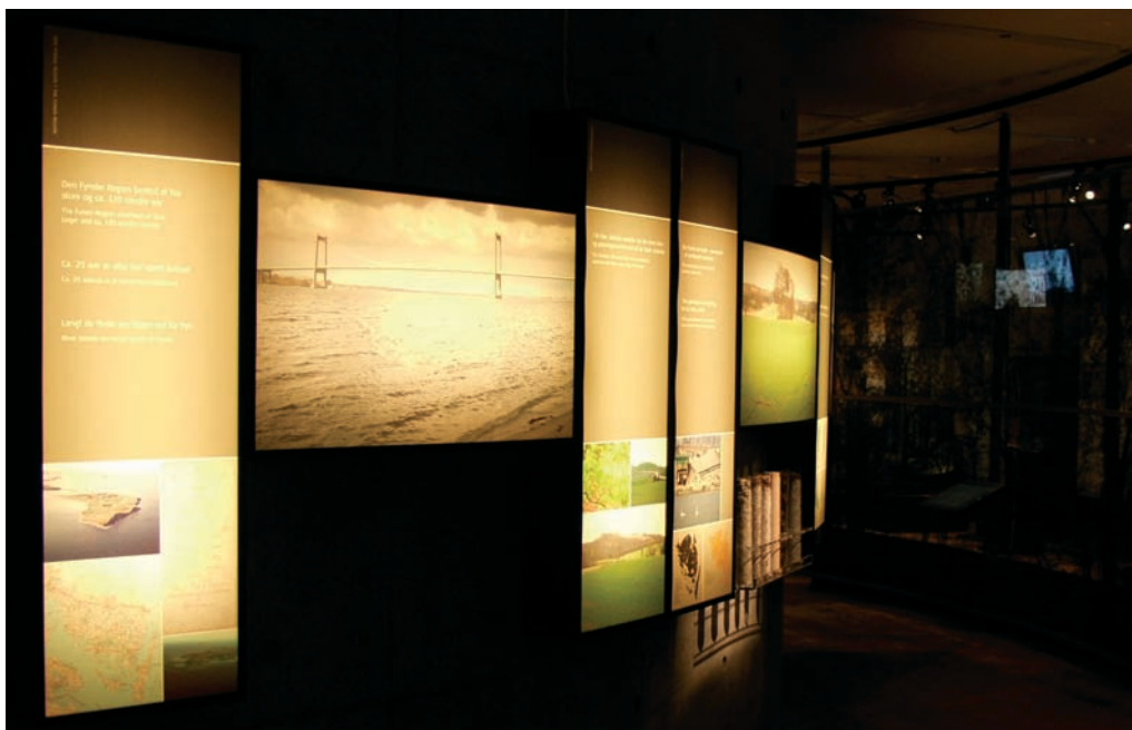
Det første, der møder muse- umsgæsten, er en frise med billeder af den fynske natur – fra Lillebælt i vest til Storebælt i øst.