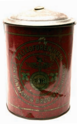
Kaffedåse fra Højsted Købmandshandel, Sjælland. Fabriksfremstillede varer vandt frem i slutningen af 1800-tallet, og det egnstypiske præg på genstandene mindskedes.

Den Fynske Landsby har som et ufravigeligt princip, at de genstande, der tages ind, udstilles og arbejdes med, skal have deres oprindelse et sted i den fynske region. Proveniensprincippet er det, der sikrer, at ikke alle landets landbrugsmuseer har præcis den samme genstandsmasse, men derimod vægter det lokale og regionale islæt. I Landsbyens nye udstilling er der dog flere ting, der stammer fra andre dele af landet end Fyn. Eksempelvis er der udstillet en kaffedåse og en sirupskande til belysning af brugsforeningernes opkomst efter næringsfrihedsloven i 1857. Kaffedåsen er fra Højsted Købmandshandel mellem Holbæk og Kalundborg, mens kanden stammer fra Allindelille Brugs nord for Ringsted. Når disse genstande alligevel har fundet vej til Den Fynske Landsby, skyldes det, at sager som disse var typiske i enhver brugsforening over hele landet i slutningen af 1800-tallet. Det er en pointe i sig selv, at det egnstypiske præg på mange genstande bliver mindre, efterhånden som fabriksfremstillede varer bliver mere og mere almindelige. Man kunne ikke se forskel på en kaffedåse fra Højsted og en fra Højby!