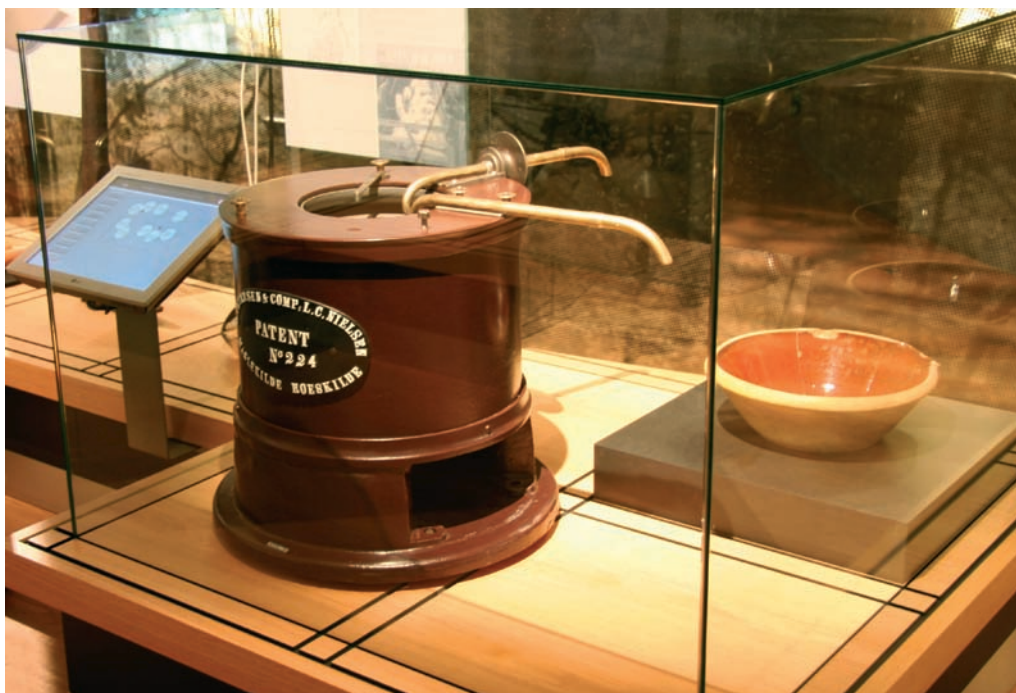
Mælkecentrifuge fra Maglekilde Maskinfabrik. Centrifugen er udstillet som symbol på den teknologi, der gjorde Andelsbevægelsens succes mulig.