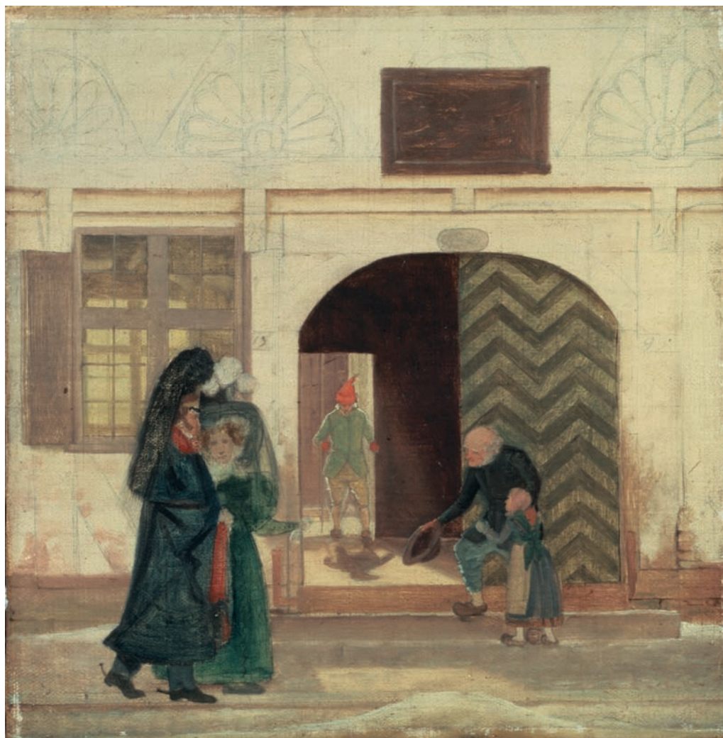
Wilhelm Bendz' ufuldendte maleri af Odense Fattiggård, 1831. Den Hirschsprungske Samling

chef. Karrieren afsluttede han under Frederik VII som generalløjtnant og kommanderende general i Nørrejylland og Fyn. Det var nu ikke alene inden for det militære, at