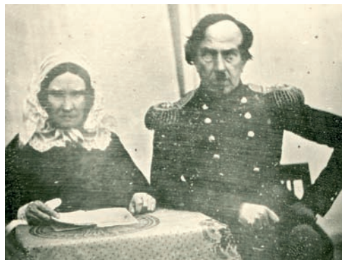
General Christian Høegh-Guldberg og hustru. Fotografi o. 1860.

Christian Høegh-Guldberg var søn af den navnkundige Ove Høegh-Guldberg, der gennem grundige teologiske og historiske studier havde skabt sig et solidt ry som lærd forfatter og via denne position havde opnået pladsen som læremester for den unge arveprins Frederik – den senere Frederik VI. Via sin position som rådgiver for enkedronning Juliane Marie og arveprinsen deltog