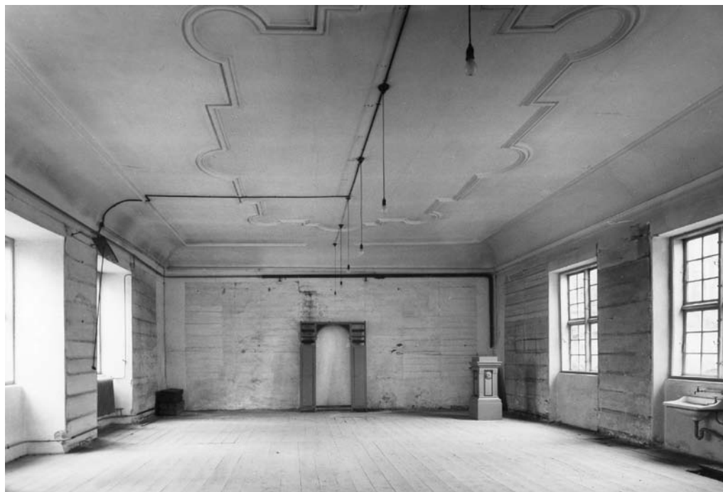
Bogsalen til "Fyens Stiftsbibliothek" i Gymnasiebygningen efter rømningen. Fotografi fra 1966.

tillige med en officerseksamen. Som ung cand.jur. og officer ved de fynske lette dragoner begejstredes han ved tanken om at etablere et bibliotek for officererne ved militæret på Fyn. Ideen om dette bibliotek var dannet under indtrykkene af Napoleonskrigene. Napoleon havde i rigt mål demonstreret, at den militære gennemslagskraft ikke alene beroede på fysisk styrke og våbenpondus, men i høj grad afhang af åndelig snilde. Rafn mente med rette, at officererne gennem studiet af militærhistorie og anden opbyggelig lektüre ville udvikle deres indsigt og dermed øge deres kunnen til gavn for landet og kro-