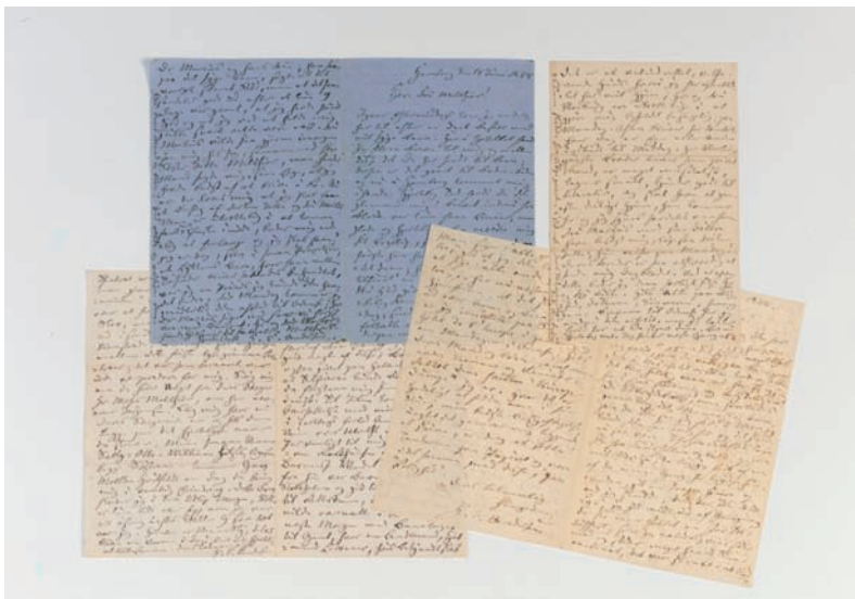
Fire af de nyerhvervede breve fra H.C. Andersen til familien Melchior, 1868.