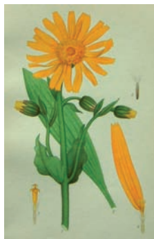
Arnica Montana , også kaldet Guldblomme og Volverlej. Den smukke og uskyldigt udseende blomst, der skulle volde H.C. Andersen så mange kvaler. Billedet er fra en privat udgave af “Nordens Flora”, udgivet af Gads Forlag 1917-23, 2. forb. udgave.

Fru Falsen 7 havde efter alt at dømme ret i sin vurdering af anvendelsen af Arnica-dråberne. For Arnica Montana, på dansk kaldet Guldblomme eller Volverlej, er ifølge en af flere samstemmende kilder en blomst med følgende anvendelse: