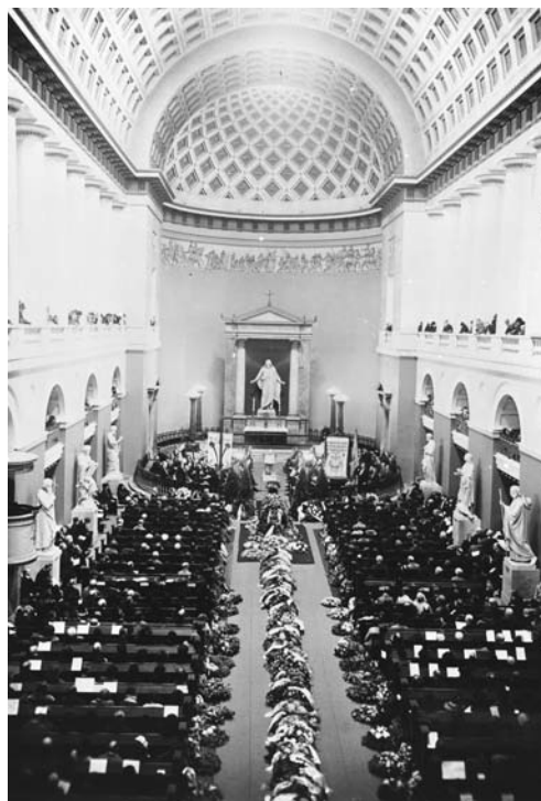
Carl Niensens begravelse i Vor Frue Kirke i København den 9. oktober 1931 blev et tilbøbsstykke og som sådan et symbol på det store tab, man led ved komponistens farvel.