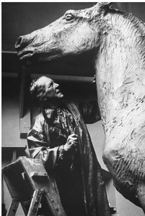
Anne Marie Carl-Nielsen og Pegasus i atelieret på Frederiksholms Kanal.

Man kunne med en Anne Marie Carl-Nielsensk vending indvende: ‘Hvis ikke vi kan skabe synlighed uden brug af et over 2 meter højt kunstværk, duer vi ikke’, men værket her er netop ikke blot stort i fysisk forstand. Det er et flag, der kan sættes i jorden som markering af de mange facetter i Anne Marie Carl-Nielsens liv og værk i største forstand. Musikkens Genius er et fornemt eksempel på hendes kraftfulde og uforfærdede omgang med motiver, dimensioner og materialer, den kunstneriske proces set i et professionelt perspektiv, hvor også en bestiller skal tages i ed, og et bevis for hendes kompositoriske talent. Værket bærer også (kultur)historien om en kvindes kamp for kunstnerisk berettigelse i en mandsdomineret verden, og sidst men ikke mindst er Musikkens Genius et udtryk for Anne Marie Carl-Nielsens dybtføjte respekt for og store kærlighed til sin mand, Carl Nielsen. Dette smukke mindesmærke kunne være en spektakulær, ja, men også værdig markering af Carl Nielsen og Anne Marie Carl-Nielsens store betydning for det danske kulturliv generelt og af de nye toner, der de kommende år vil lyde fra Carl Nielsen Museet i Odense især.