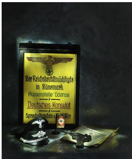
Tyske genstande fra 2. verdenskrig udstillet i Fyn – midt i verden

Med en æstetisk udstilling lægger museet vægt på, at udstillingen skal være en smuk oplevelse. Gamle museer havde festlige farver på væggene, rød, gul, blå, og markante mønstre i gulvet. I dag vælger man ofte at nedtone væggenes farve og udstille på diskrete lyse baggrunde. Der må gerne være lidt stille, - og stole, evt. til at tage med rundt, til den særligt interesserede museumsgæst. Museet vil gerne lade dig nyde de udstillede genstandes skønhed. 2