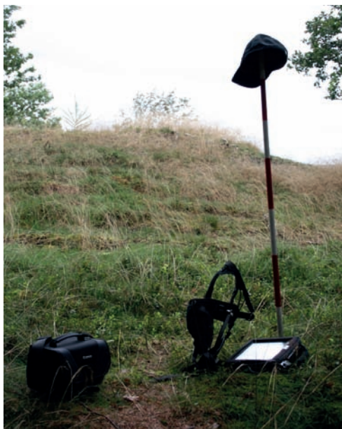
Herredsberjernes notesbøger er erstattet af moderne fotoudstyr og en bærbar feltvenlig PC.

Ud over de planlagte besigtigelser er der med tilsynsopgaven også tale om ad hoc tilsyn, hvor museet af Kulturarvsstyrelsen tilkaldes til igangværende beskadigelser af fortidsminder og sten- og jorddiger, især det sidste. Her kan der være tale om at benytte de muligheder, der er i loven, til at standse et igangværende ulovligt arbejde. Alle oplysninger tages ind i tilsynsdatabase, der med jævne mellemrum afrapporteres til styrelsen forsynet med up to date-billeder, og den nøjagtige position af fortidsmindet.