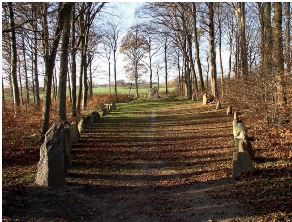
Et af Fyns flotteste fortidsminder, Glavendrup skibssætning og runesten med den længste kendte runein-skription taget i vintersol på besigtigelse, foto Ellen Warring.