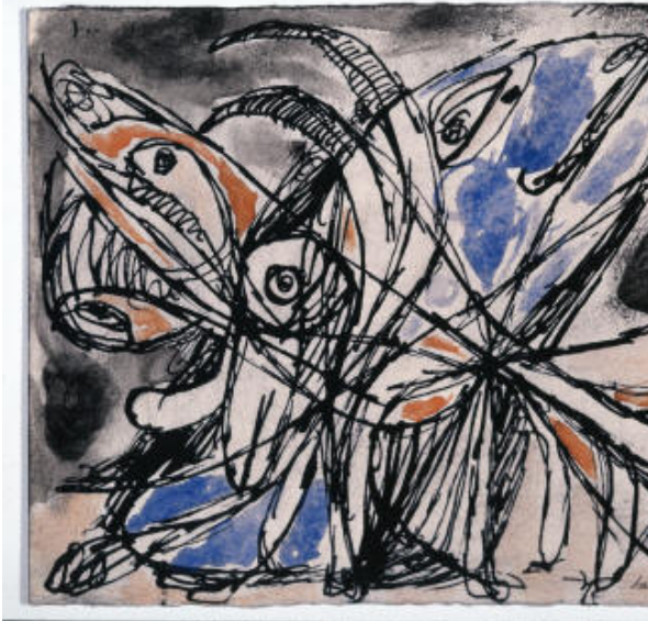
Asger Jorns tegning, Komposition . 1951

Selv om Cobra havde rødder i surrealismen, tog sammenslutningen afstand fra den gren heraf, der udmøntede sig i geometrisk abstrakt retning. Cobra fandt, at denne konkrete kunst var alt for objektiv, kølig og intellektuel. I stedet sigtede Cobra gennem en spontan og ekspressiv kunstnerisk arbejdsmetode på at åbne op for sindets inderste, for ad subjektiv vej at få fat i det fantasifulde, i det fabulerende og i magien, som kom til udtryk i ældre kunst, i folkekunst og som stadig var bevaret i visse fremmede kulturers kunst samt i børnetegninger.